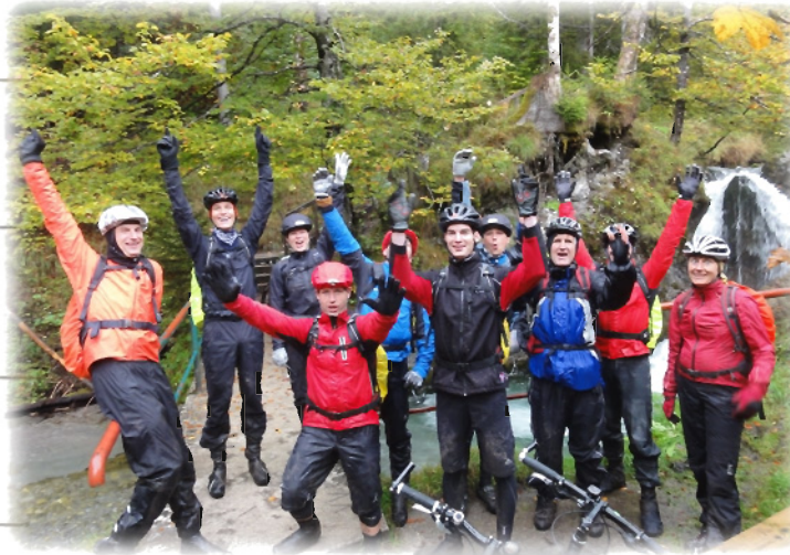
Einfach mal freuen zwischendurch...