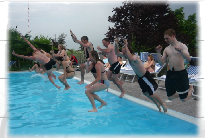
...und Sprung in den Hotel/Pool